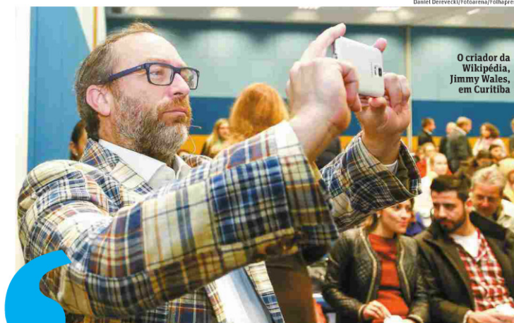
O criador da Wikipédia, Jimmy Wales, em Curitiba

O fundador mais conhecido da enciclopédia livre Wikipédia, Jimmy Wales, um habitué das listas de pessoas mais influentes do mundo, já planeja trazer seu novo projeto ao Brasil. O TPO (The People's Operator) é uma operadora virtual fundada em 2012, que direciona recursos para caridade. Para ele, o Brasil tem características de um potencial celeiro para inovações tecnológicas e é um mercado que lhe interessa.